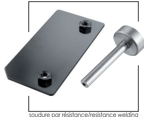
soudure par résistance/resistance welding